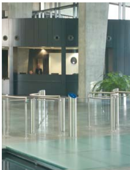
W foyer budynku – kołowroty Charon zainstalowane w zasięgu wzroku pracowników recepcji.