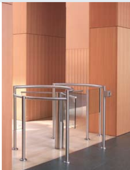
Harmonijnie skomponowana całość: ciepłe drewno, szkło i stal nierdzewna.