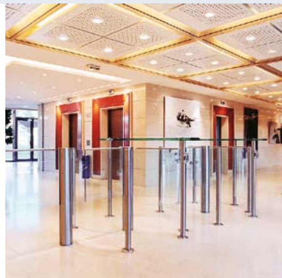
Wykonanie specjalne – z zastosowaniem skrzydeł szklanych o podwyższonej wysokości.