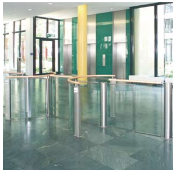
Oszczędność miejsca – przejście osobowe i transport materiałów w jednym; specjalny Charon: dwuskrzydłowy kołowrót zintegrowany z bramką uchylną.