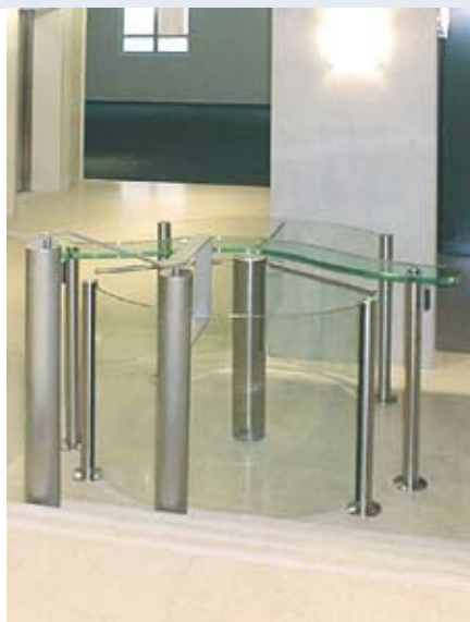
Problem wąskiego przejścia: rozwiązany elegancko przez zastosowanie kołowrotu Charon.