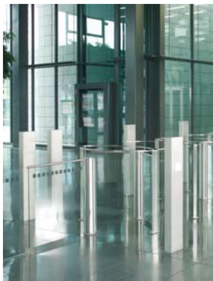
Odpowiednio dobrana bramka uchylna – przejście kontrolowane, przyjazne osobom niepełnosprawnym.